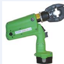
D62 ELEC 14,4v

DIE SETS - MATRICES - SERTISSAGE / CRIMPING